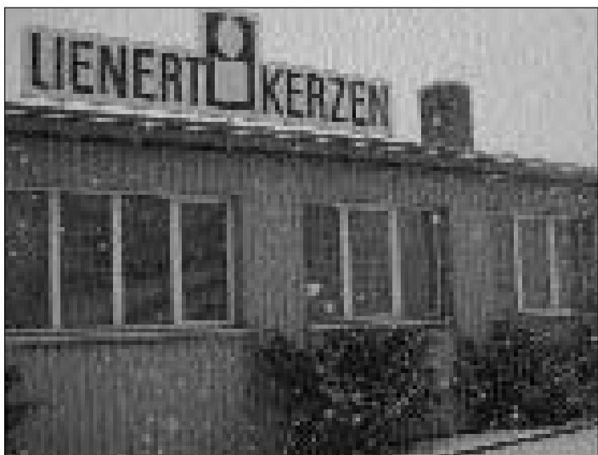
Ordadora cuffli. Endadens en la fabrica da chandailas Lienert èsi flot chaud e savura da tschaira d'avieuls.

chauda. Il davos, cura che la grossezza giavischada è cuntanschida, vegn la «chandaila» da plirs meters tagliada en tocca. La maschina dals Lienert's tira en in turnus da lavur mintgamai quatter chandailas d'ina lunghezza da 100 meters.