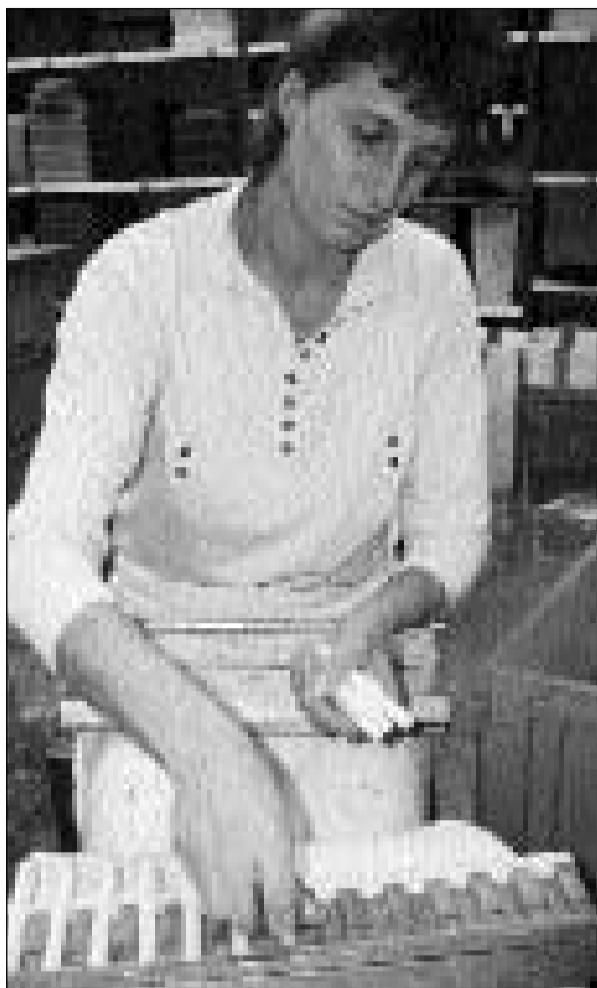
La donna caveglia las chandailas da Nadal sin la glista per suenter colurar ellas en il bogn.