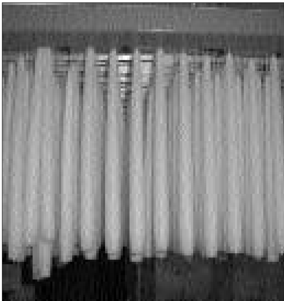
Ins po producir chandailas en quatter guisas. Questas chandailas han ins fatg cun sfunsar il lamegl en il bogn da tschaira.