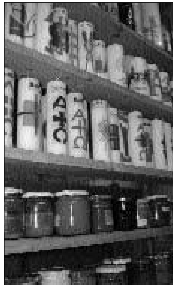
En l'atelier da decorar lavuran ins cun differentas tecnicas: Serigrafia, relief, stampar fotografias etc.