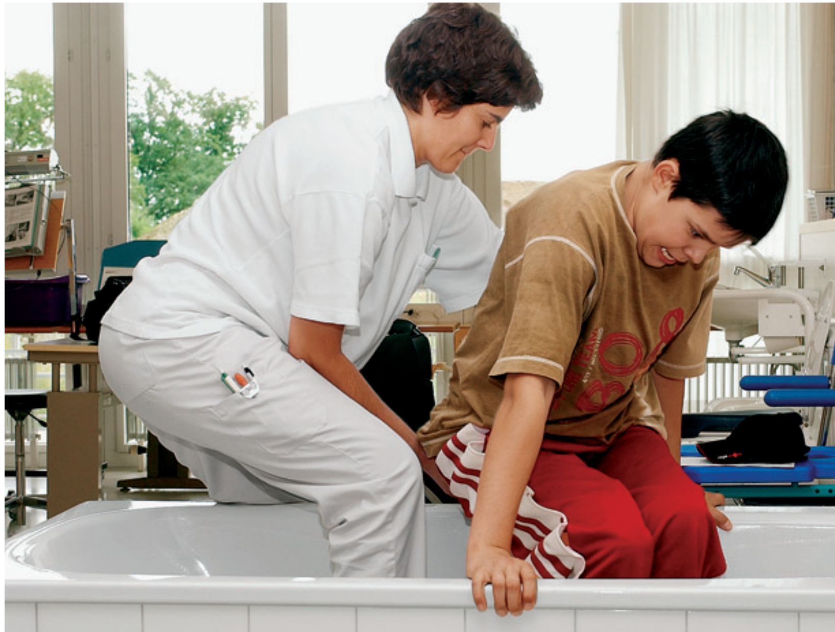
Stentus: il transfer en la bognera consumescha las forzas dal paraplegicher da 12 onns