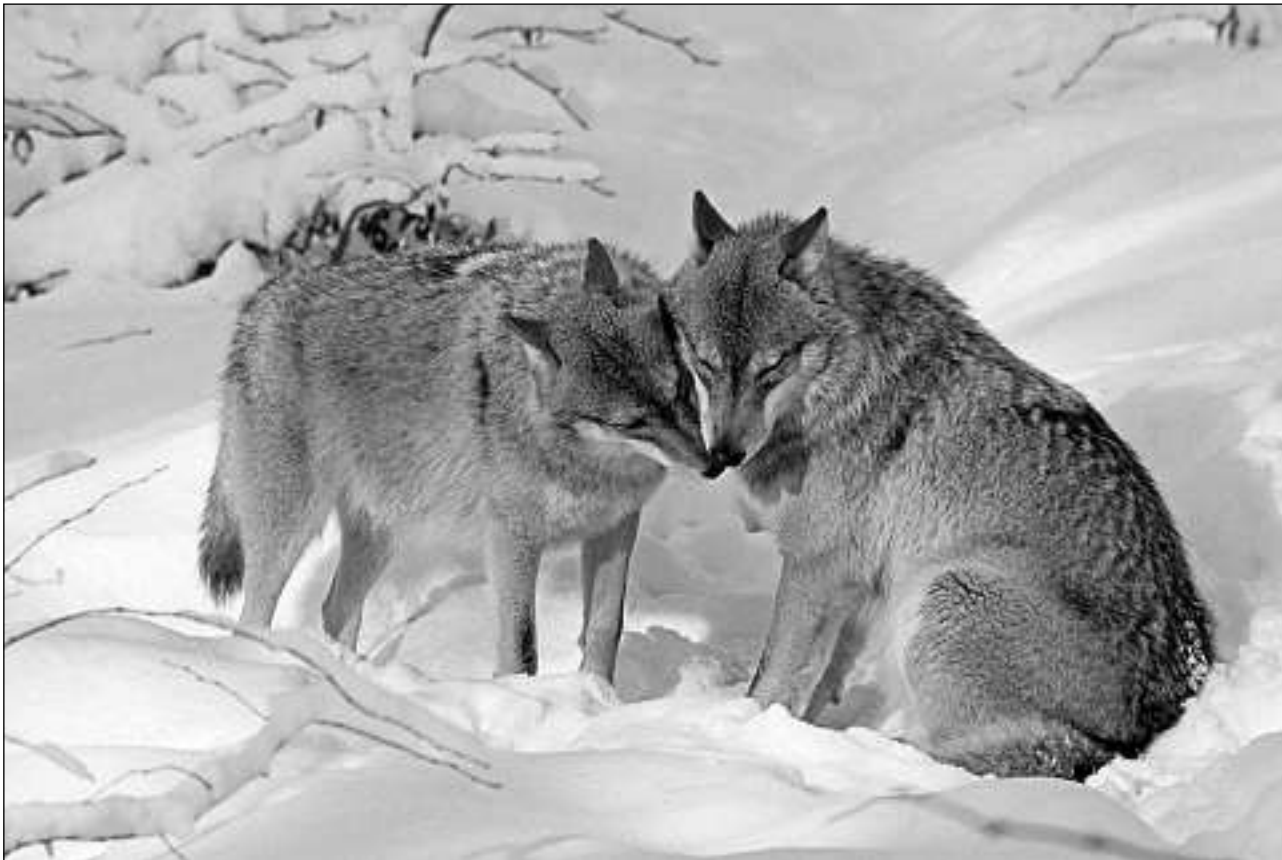
Dus lufs èn ils Rocky Mountains a Canada.