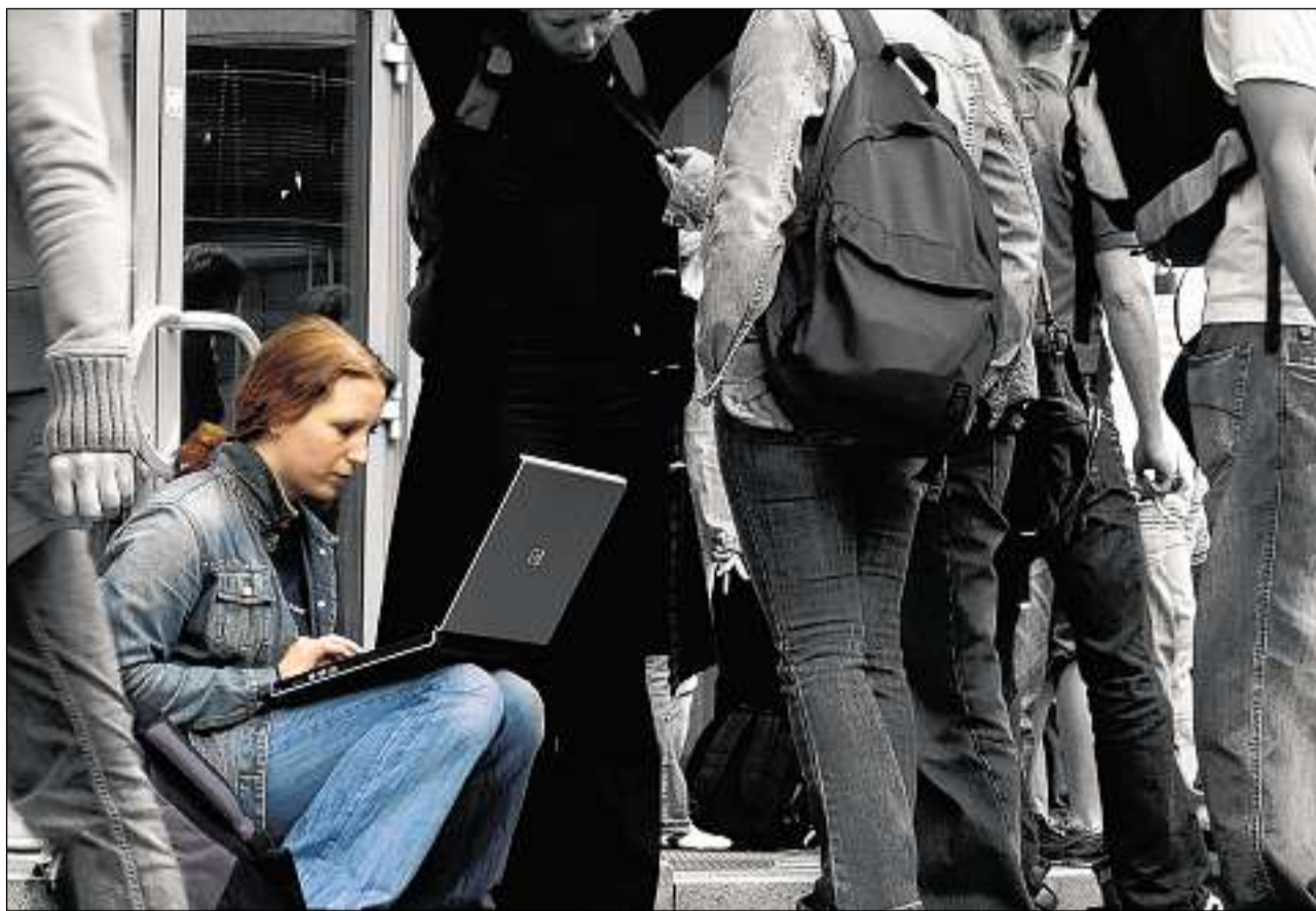
Schanzas egualas en furmazium e professiun – ina sfida er en l'avvenir.

A las universitads svizas è il dumber da las studentas e dals students dal Grischun s'augmentà levamain ils ultims onns. Quest augment ston ins surtut at-