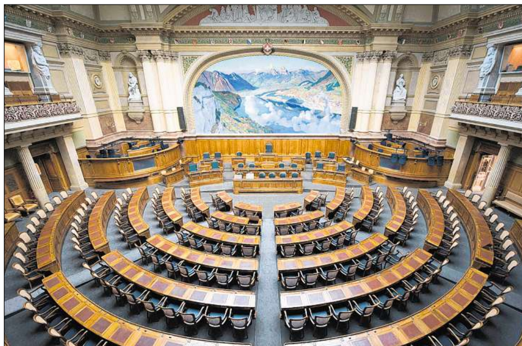
La sala dal Cussegl naziunal.

En il Cussegl naziunal vegnan translattadas las deliberaziuns en moda complessiva. Mintga commember dal Cussegl naziunal ha la pussaivladad da tadlar en sia piazza la translaziun simultana per talian, per franzos u per tudestg. En il Cussegl dals chantuns na datti naginas translaziuns simultanas.