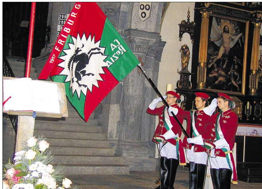
Salid cun la bandiera.