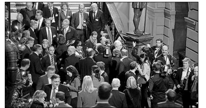
Gronda fulla sin la stgla da l'entrada principala: Il di da las elecziuns è era il di da las medias.