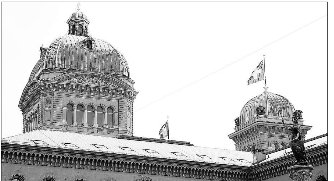
Las trais cuplas traglischas: Las bandieras che èn tratgas si inditgeschan ch'il parlament è sa radunà a Berna per la sessiun.