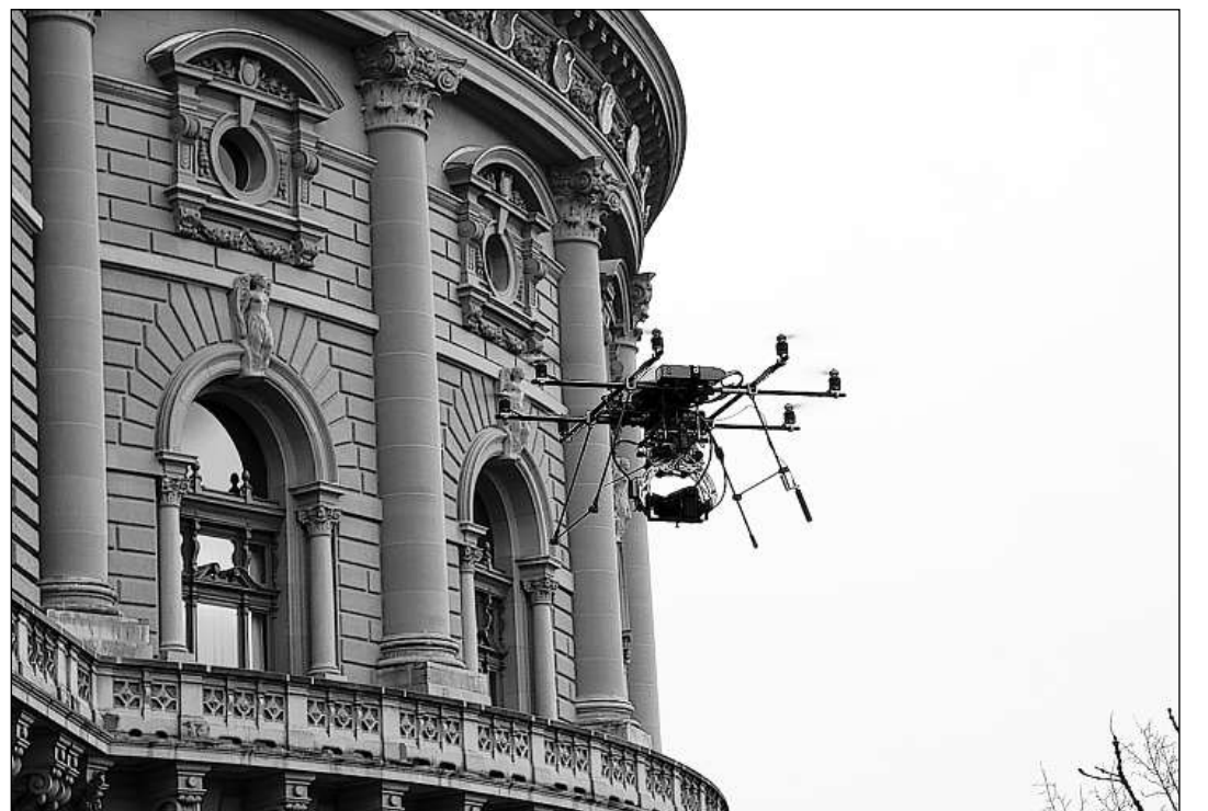
«Il «spion» cun telecomond che transmetta maletgs panoramics sgola gist sur la terrassa da la chasa federala.