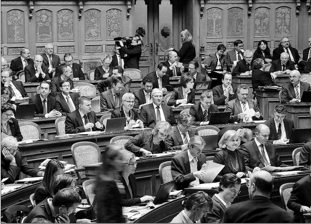
L'assemblea ha gist dà giu ils cedels per l'elecziun dal president da la confederaziun. La televisiun è preschenta en sala (retscha sisum).