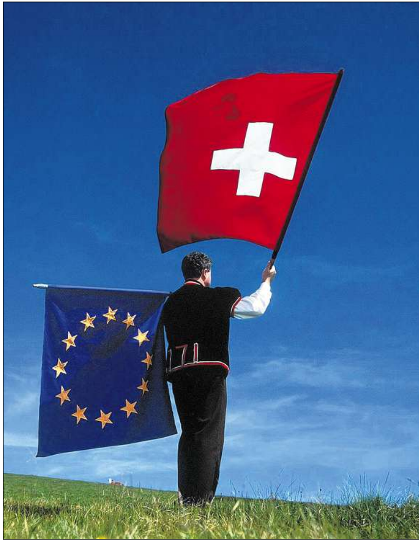
Dapi 50 onns fa la Svizra part dal Cussegl d'Europa.

Thürer, vischin da Cuir e Valzeina, parura da la Societad tudestga da dretg internaziunal, ha mess ad ir la fundaziun «Convivenza – Center per minoritads» (Mustér). El scriva en ses emprim paragraf: «Igl è in paradox che (...) la genesis d'organisaziuns europeicas è sa spjegada en Svizra, ma che questa è sa mussada ordvart reservada areguard ils fritgs da lez svilup: Ella è vegnida commembra dal CE pir avant tschinquanta onns» (p. 21). Suenter la Segunda guerra mundiala, «probablmain la pli brutala en l'istorgia