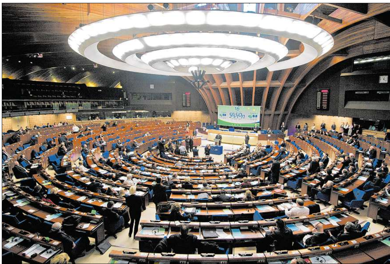
Sesida plenara en il cussegl d'Europa a Strassburg nua che la Svizra è represchentada dapi l'onni 1963.