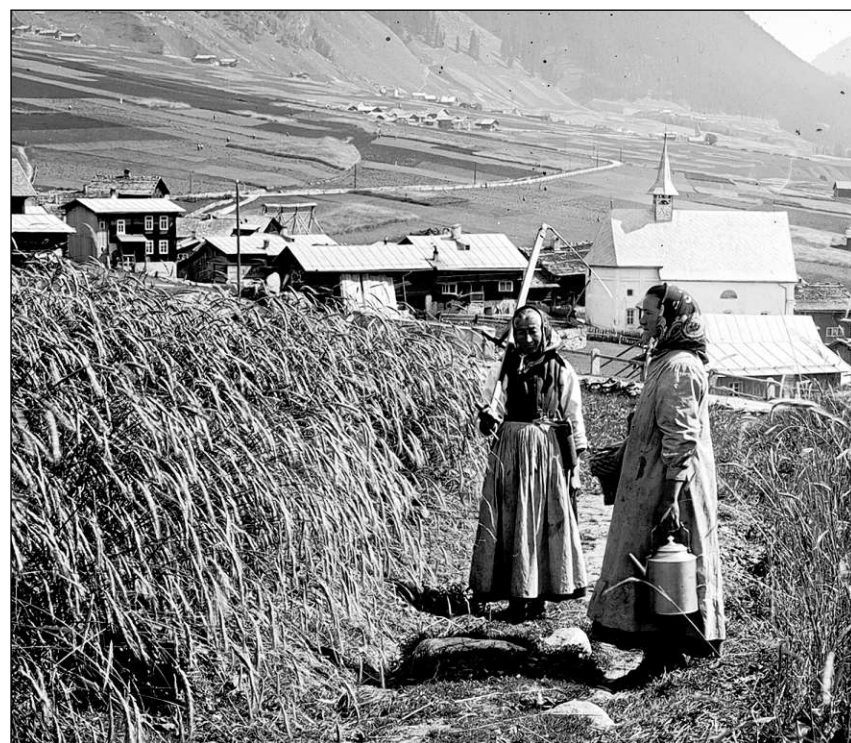
Champs da grenezza a Rueras enturn il 1920.