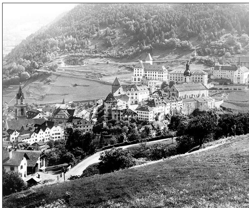
Part da Cuira cun la curia enturn il 1900.

Exposiziun «Truvaglias e travaglias» dals 19 da settember 2013 fin il december 2013 en il 1. plaun da la Biblioteca chantunala dal Grischun a Cuira.