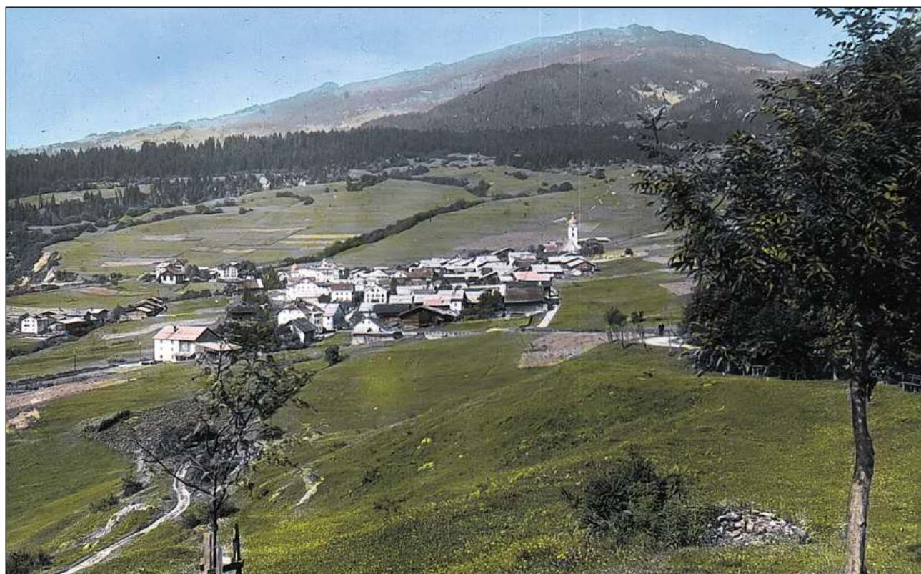
Il vitg da Flem enturn l'onn 1920.