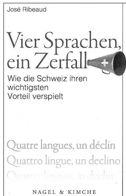
Frontispizi da l'ovra.

Sut quest titel deditgescha l'autur in lung artitgel a la Rumantschia che fa ora 0,6% da la populaziun svizra. I sa tracta dad ina invista ed analisa profunda da la situaziun actuala da noss linguatg. Sia survivenza dependia da quels che discurren quest linguatg e da tals che decidian sur-londer en il Grischun. Il destin dal linguatg rumantsch stoppia dentant er occupar las ulteriuras cuminanzas linguisticas e las autoritads federalas. Extendamain vegn mussà co il rumantsch è vegnì, sa sviluppà e vegn tgirà en scola ed en la litteratura.