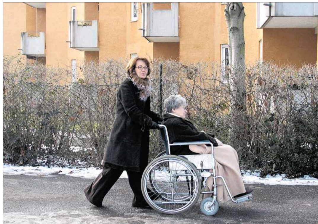
Lavur voluntara ha bleras fatschas.

Ils umens prestan la pli blera lavur vo-