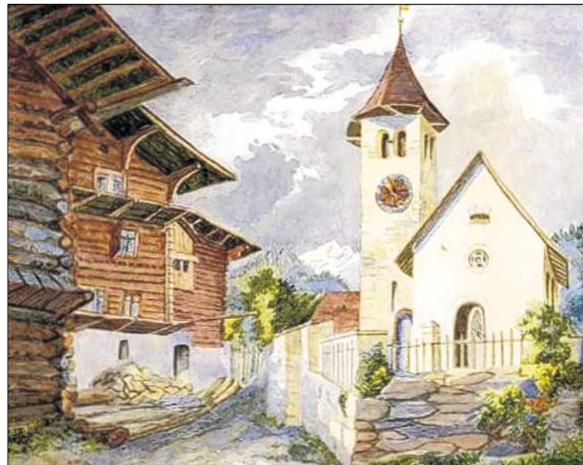
Baselgia reformada da Maladers.