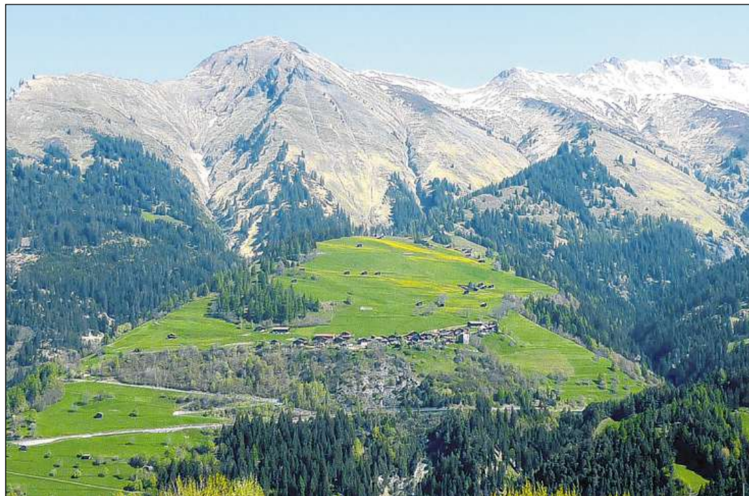
Calfraisa cun la ruina da Bernegg. Davosvart il Montalin e la chadaina da Hochwang.

Il LIR cumpiglia bundant 3100 artitgels (geografics, tematics, artitgels da famiglias e biografias) davart l'istorgia grischuna/retica e la Rumantschia. Editura: Fundaziun Lexicon Istoric Svizzer; versiun online: www.e-lir.ch ; versiun stampada: www.casanova.ch u en mintga libreria.