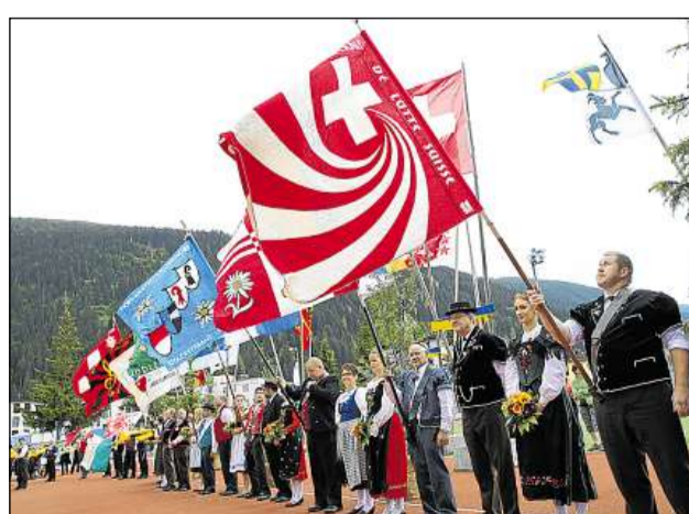
Per ils proxims trais onns resta la bandiera da la federaziun dals jodladers a Tavau.