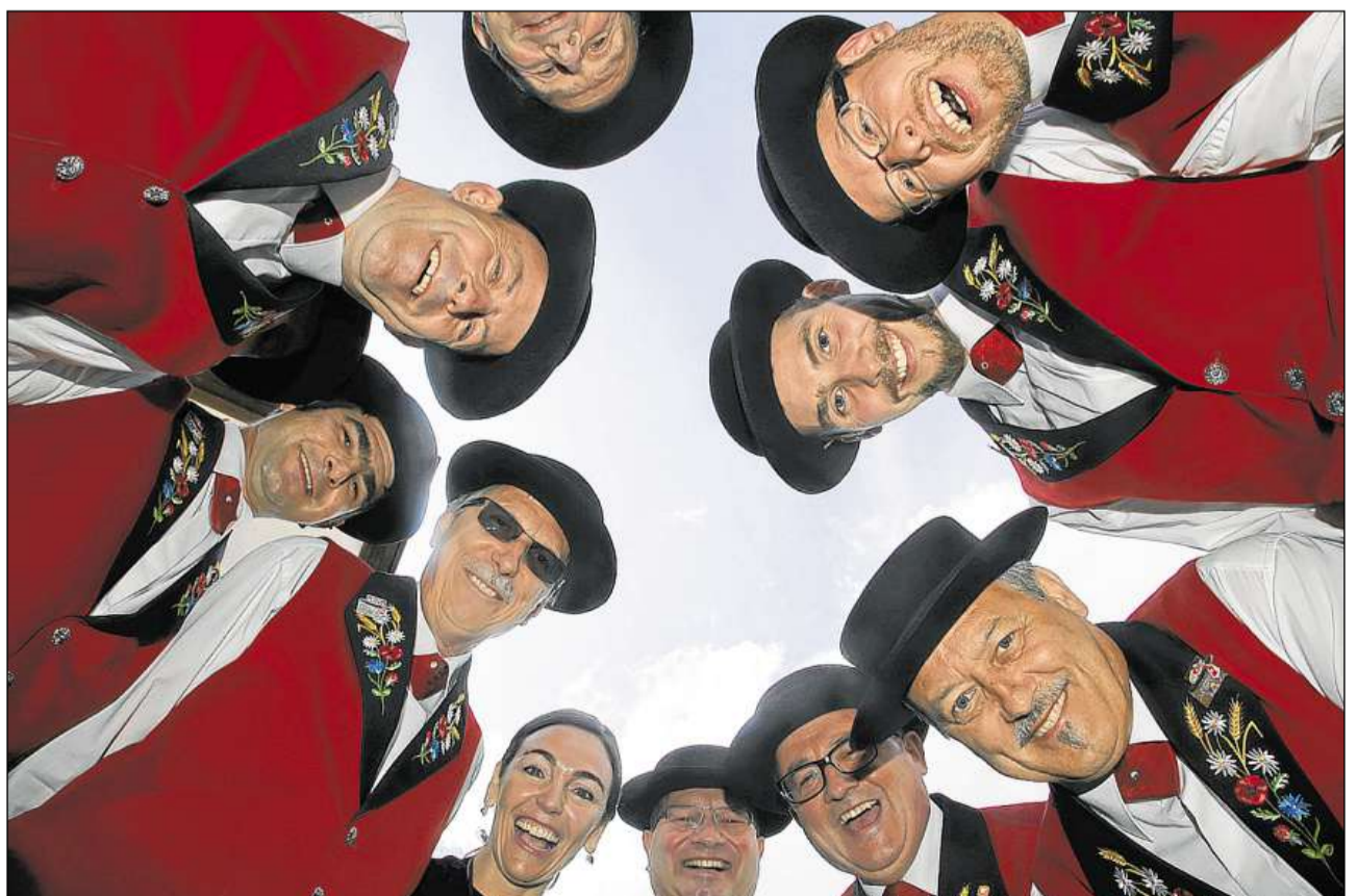
Buna luna, quai è stà il motto tar la gronda festa a Tavau.

Dals 362 chors da jodladers ha pli che ina terza retschet il predicat fitg bun. Ferm represchentà a Tavau è cunzunt stà il chantun Berna e lura ils chantuns da la Svizra centrala. Success tar la 29. Festa federala da jodladers han dentant er gi intginas furmazions grischunas. Il Chor da jodladers «Sardonna» Flem ha retschet la nota maximala da 4, quai han ils giurors er dà als jodladers dal Chor «Carschenna» Seglias ed al Chor da jodladras «Steilalva» Seglias. Er la nota maximal ha retschet l'«Aelplerchörli Vaz» per sia chanzun «Maria la Regina dil tschiel», dal reminent l'unica chanzun rumantscha tar la festa, cun la quala il chor ha procurà per pel giaglina tar intgins en il public.