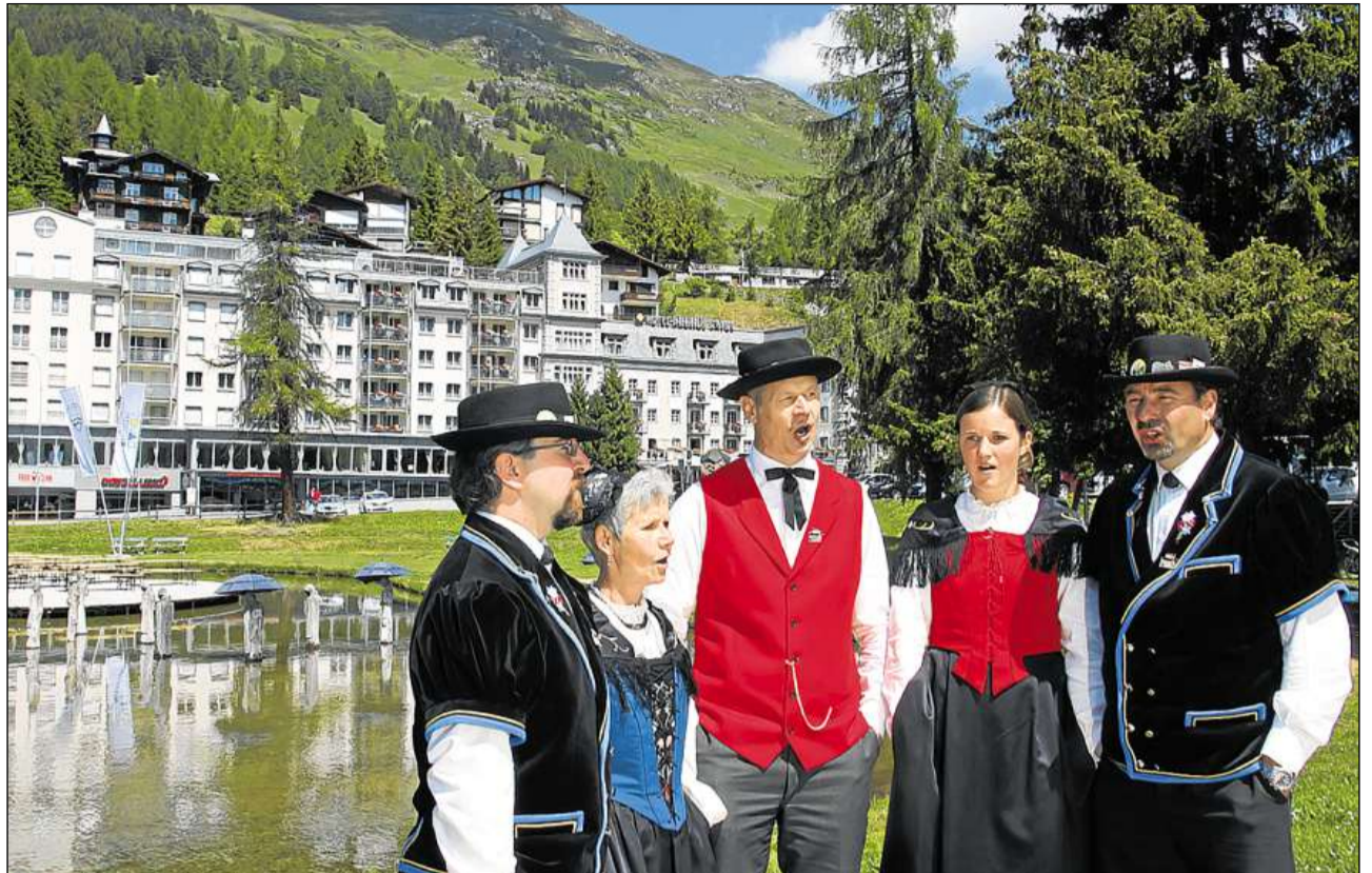
Dapertut sut tschiel avert è vegni jodlà e chantà.