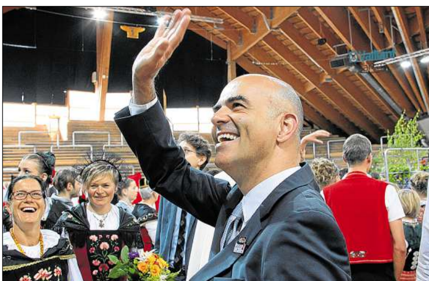
Cusseglia federal Alain Berset ha tegni il pled da festa.