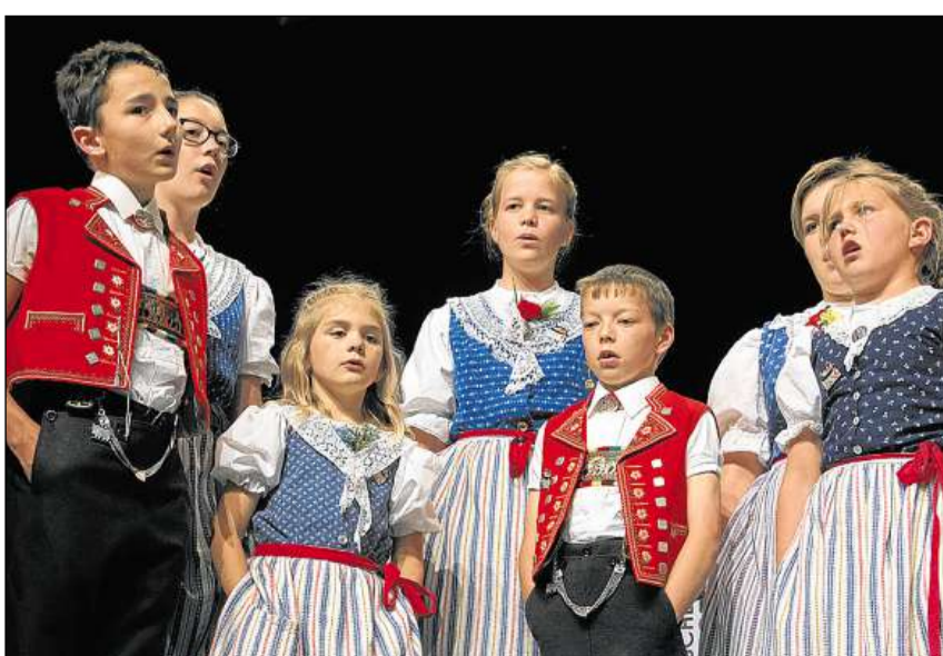
Tar ils jodladers manca betg la generaziun giuvna.