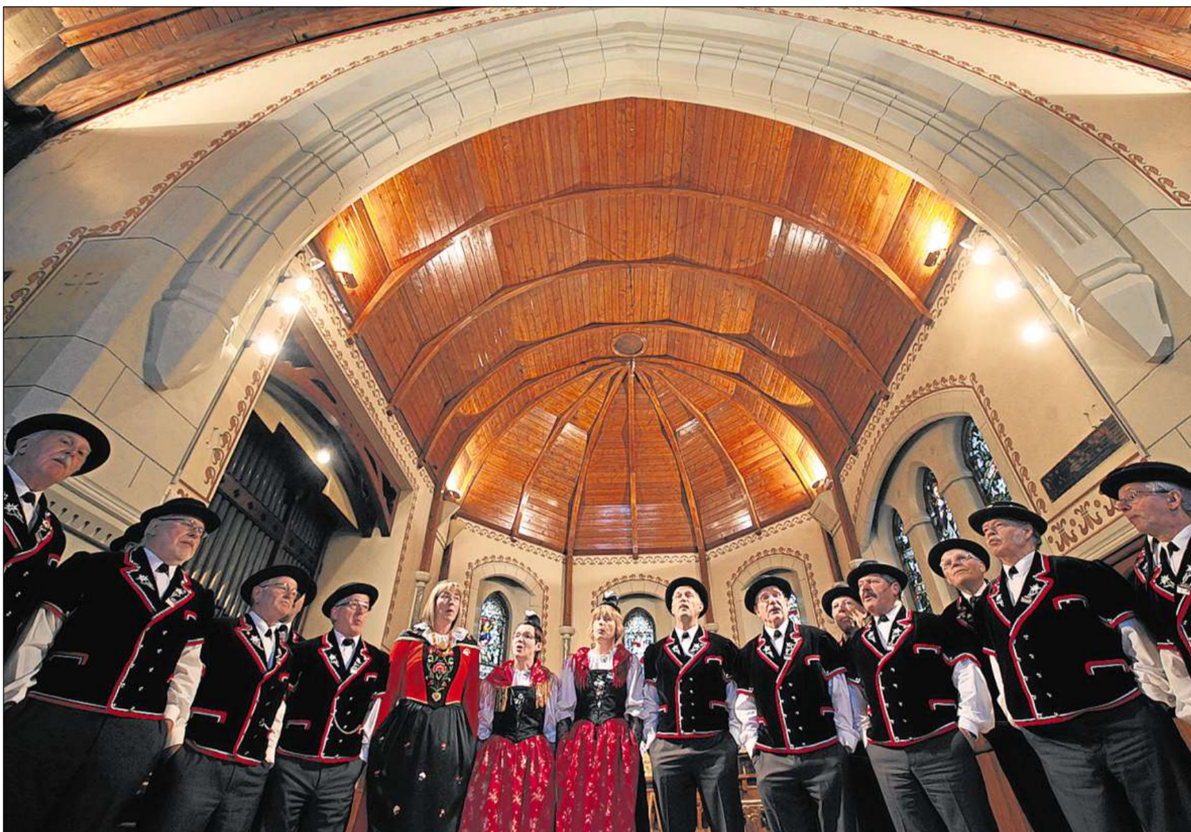
Buna acustica cunzunt en las baselgias.