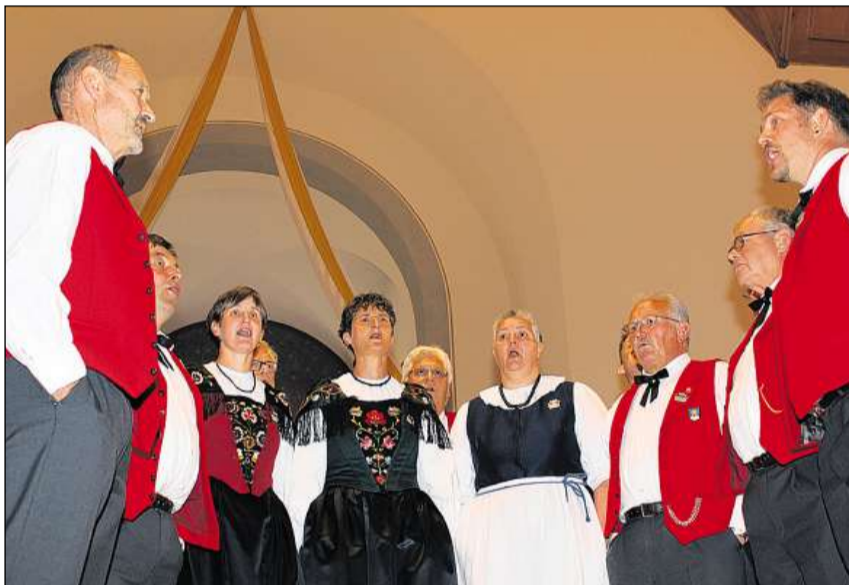
Il Chor da jodladers Arosa durant sia produziun en la baselgia da Nossadunna.