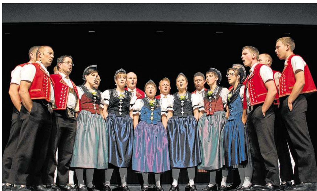
Ina festa federala da jodladers senza furmaziuns appenzellesas fiss segir betg cumpletta.