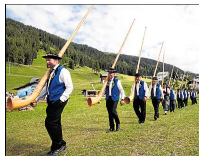
Ina tradiziun en Svizra è er il sunar tibas.