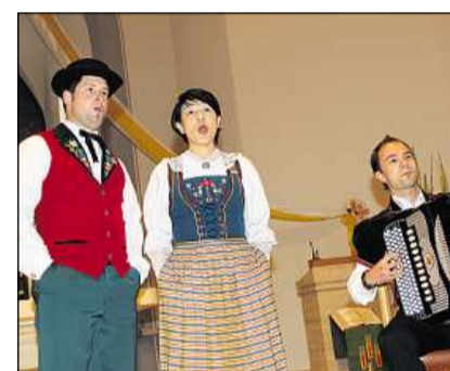
Er furmaziuns da l'exteriur èn sa participadas a la festa a Tavau.