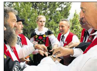
Schnuffar, quai tutga tar jodladers e jodladras.