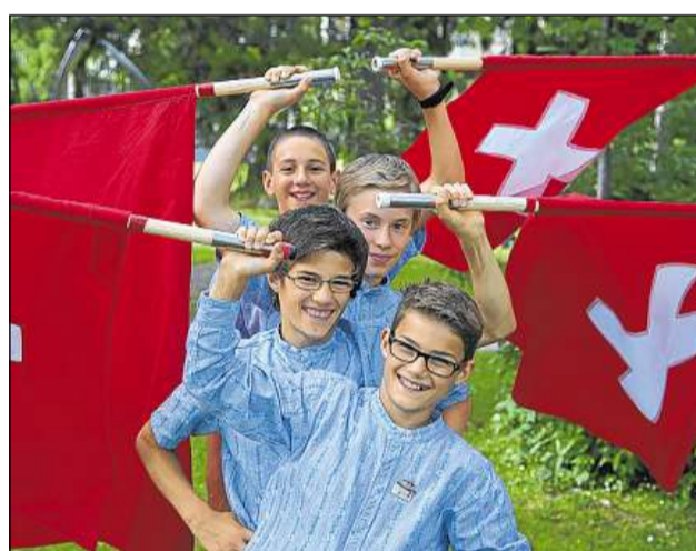
Quai è il cas er tar ils bittabandieras.