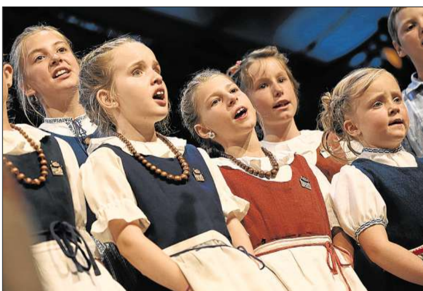
Il Chor d'uffants Randulina da Seglias.