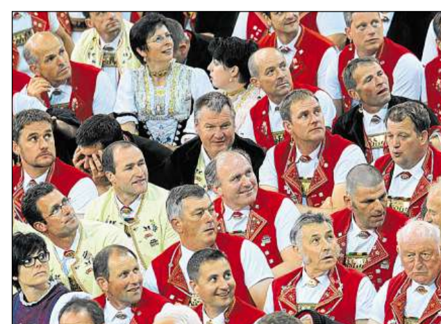
Jodladers e jodladras persequiteschan cun interess l'act da festa.