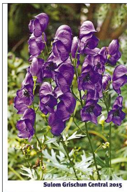
Frontispizis dals chalenders.