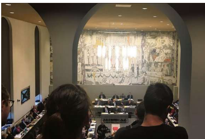
Gronda atenziun per la debatta er da la tribuna anora.