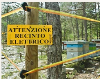
Chamona d'avieuls cun saiv electrica

Il's urs prendan quai ch'els dovran per viver. Per il's purs ed apiculturs po quai daventar in problem. Il's problems sa laschan però schliar. Chamonas d'avieuls pon ins proteger cun saivs electricas cunter il's urs magliucs. Chauns da protecziun stgatschan l'urs da muntaneras da nursas e chauras. Sch'in urs mazza in animal da niz, vegn quel indemnisà cumplettaimain tras la Confederaziun ed il Chantun. Per evitar ch'il's urs tschertgian lur vonda en territoris abitads, vegnan allontanadas las vanzadiras en recipients betg accessibels a l'urs.