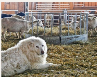
Il's chauns da protecziun pertgiran las mun ateras