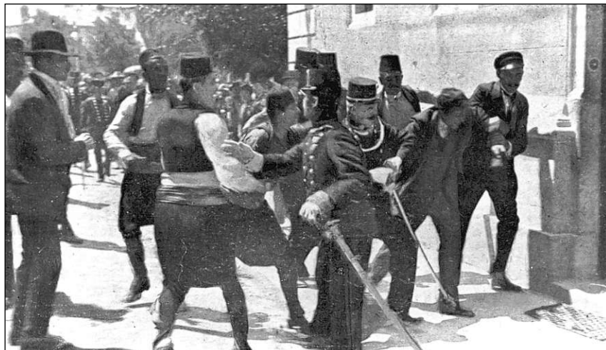
Trais giuvens da la Bosnia – dus Serbs ed in muslim – han preparà l'attentat cun l'agid da «Maun nair». Els dus culps mortals ha dà il student serb Gavrilo Princip (1894–1918).