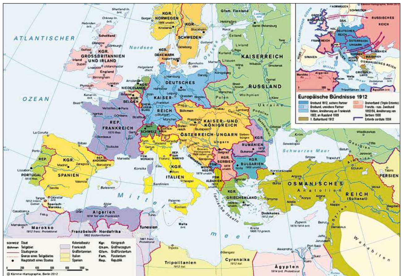
L'Europa avant l'Emprima guerra mundiala da 1914.

sa 21 milliuns olmas il 1914), vegni mazzà sapientivamain d'in Serb? La resposta dat il nazionalissem statal, pia l'irredentissem dal reginam serb, independent dapi 1882. Els nazionalists serbs levàn stgaffir ina Serbia gronda «da la Bosnia ed Erzegovina sur il Banat da Temesvár/Timisoara (...), la Croazia e Dalmazia enfin a l'Adria, da Trieste a l'Albania dal nord» (p. 46). Ins spetgava pia ch'els Croats acceptian da vegnir clamads «Serbs». Ins saveva che l'archiduca planisava da dar dapli autonomia als pievels slavs da l'imperi; quai fiss stà ina catastrofa per ils plans nazionalistics da Serbia gronda. Sin quai han las autoritads austriacas pinà in viadi uffizial da l'archiduca e da sia consorta a Sarajevo, chapitala da la Bosnia, per la dumengia, 28 da zercladur; l'Austria-Ungaria aveva annectà quest pajais il 1908 sco possess cuminaivel da l'Austria e l'Ungaria. Els irredentists serbs resguardavan lezza annexiun sco in affrunt. Tant pli che Vienna n'aveva betg resguardà la festa serba ortodoxa da «Vidovdan» («di da s. Vitus»), precis il 28 da zercladur tenor noss chalender, che commemorescha la battaglia da Cosovo (1389): «Per ils ultranazionalists serbs, saja quai en Serbia u en l'entira rait irredentistica da Bosnia, muntava la visita dal prinzi ereditari quel di a Sarajevo in affrunt simbolic che pretendeva ina resposta» (p. 427). Trais giuvens da la Bosnia – dus Serbs ed in muslim – han lura pinà l'attentat cun