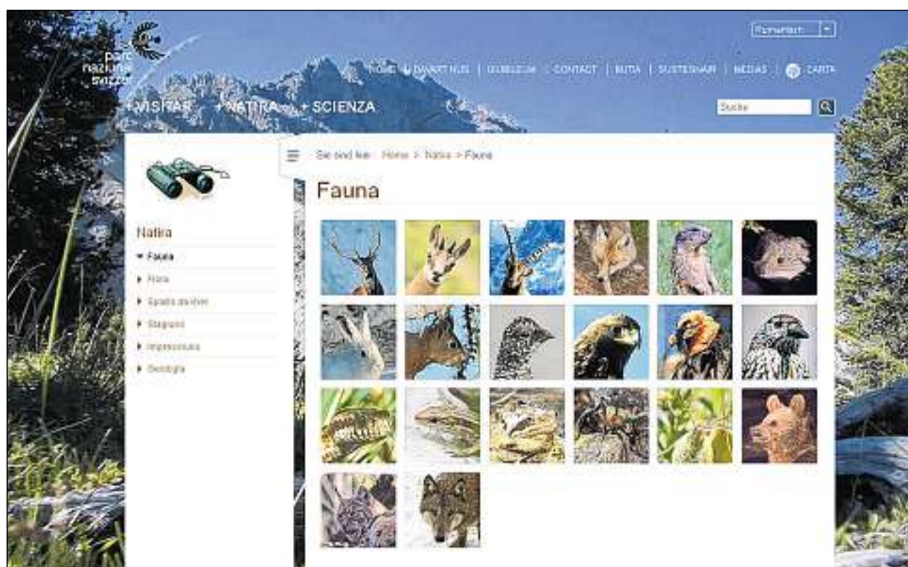
Sin la pagina d'internet dal PNS vegn preschentada tranter auter la fauna variada che viva en quest reservat.