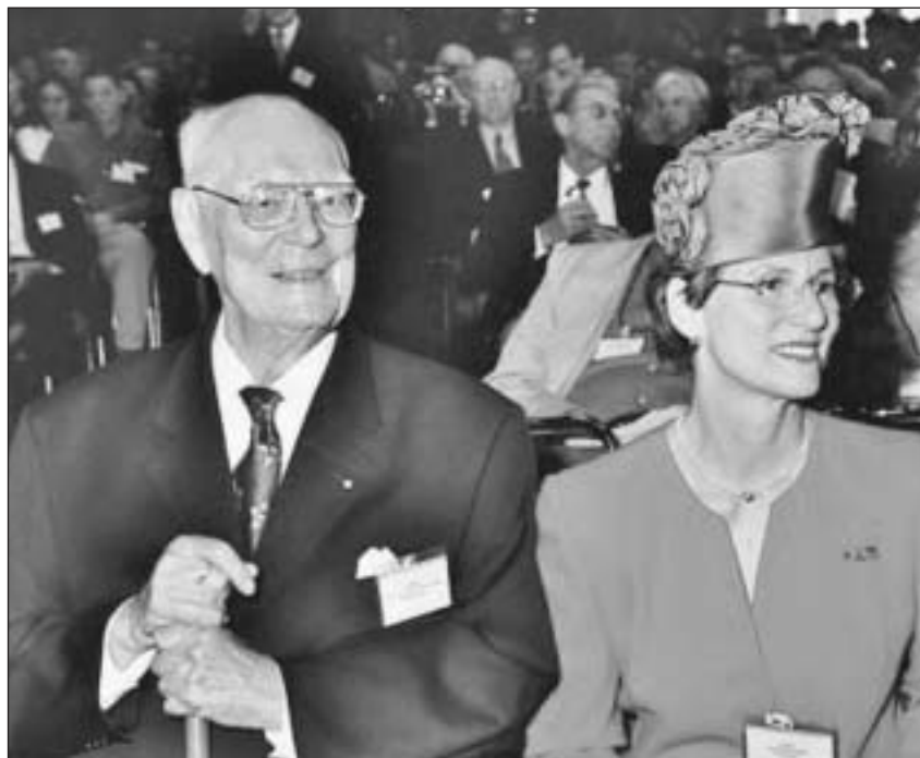
Lennart Bernadotte ha transformà l'insal da Mainau en ina mar da flurs e plantas exoticas. Sia dunna Sonja administrescha l'insla dapi igl onn 1981.

Jean-Baptiste Jules Bernadotte (1763–1844) è naschì en l'Aquitania, a Pau, al pe da las Pireneas, sco figl d'in advocat. Il roman istoric «Les trois mousquetaires» (1844) d'Alexandre Dumas (1802–1870) ha perpetuisà quels giuvens da Gascogna che gievan a servir la Frantscha che gievan a servir la Frantscha sco mercenaris. Quai ha fatg era Bernadotte 1780; 1804 è l vegnì marschal ed ha survegnì la «Légion d'honneur». Sco guvernatur da la Germania dal nord occupada da Frantscha, ha manà la guerra cunter la Svezia, ma ha fatg la pasch suenter la revoluziun da 1809 a Stockholm che ha dà la curuna a Carl XIII (1748–1818). Bernadotte era lur uschè bain vesì en Svezia ch'il retg