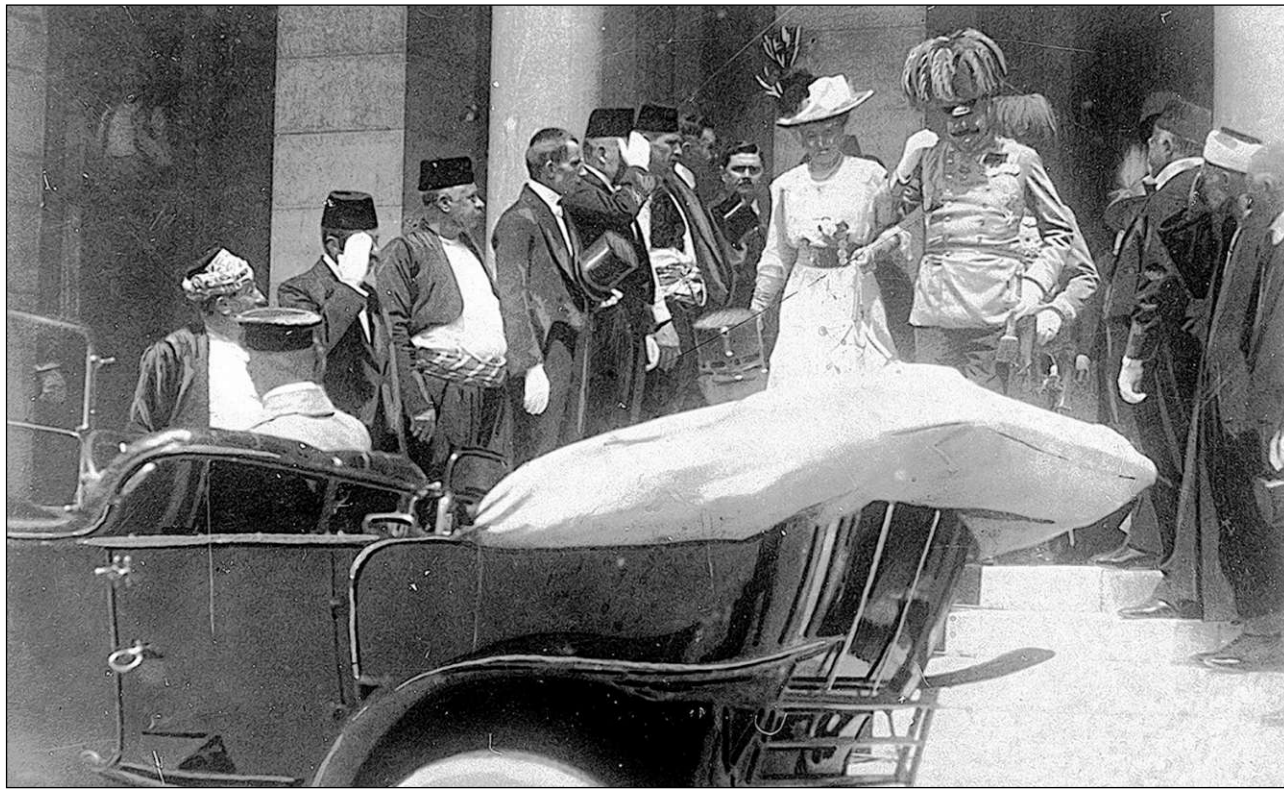
Paucas minutas avant l'attentat dals 28 da zercladur 1914 a Sarajevo sin l'archiduca Francestg Ferdinand d'Austria-Este (*1863), ertavel da l'imperi austriac e dal reginam ungarais, e sia consorta duchessa Sofia Chotek da Hohenberg.

L'istoricher Christopher Clark (Universitad da Cambridge) ha deditgà in essai fundamantal dad 896 paginas als svilups politicis europeics che han manà a l'Emprima guerra mundiala (2); el rapporta mandlmain davart la vita da l'archiduca suenter sia marida. L'emprim descriva Clark la discriminaziun dals linguatgs da las minoritads en la mesadad ungaraisa da la monarchia: «Ils parlamentaris ungarais controllavan passa 90% dals mandats, schebain ch'i represchentavan mo 48,1% da la populaziun (...). Las leschas prescrivevan il diever da l'ungarais en tut las scolas dal stadi e da las baselgias; quai valeva perfin per quellas persunas che devan da mangiar als uffants