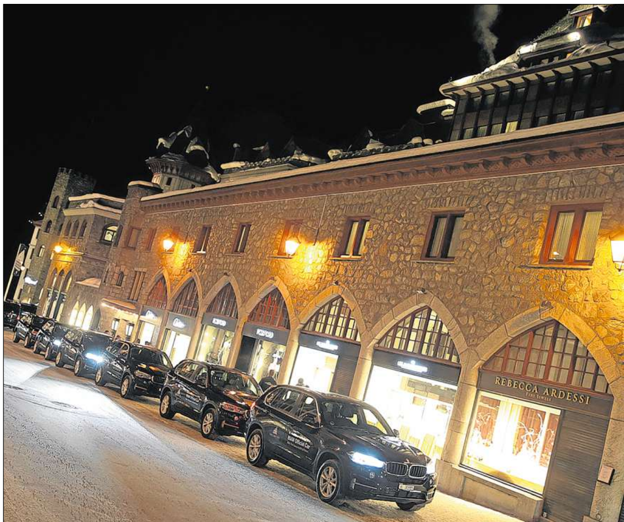
Cun autos da luxus da hotel tar hotel durant la Gourmet Safari.