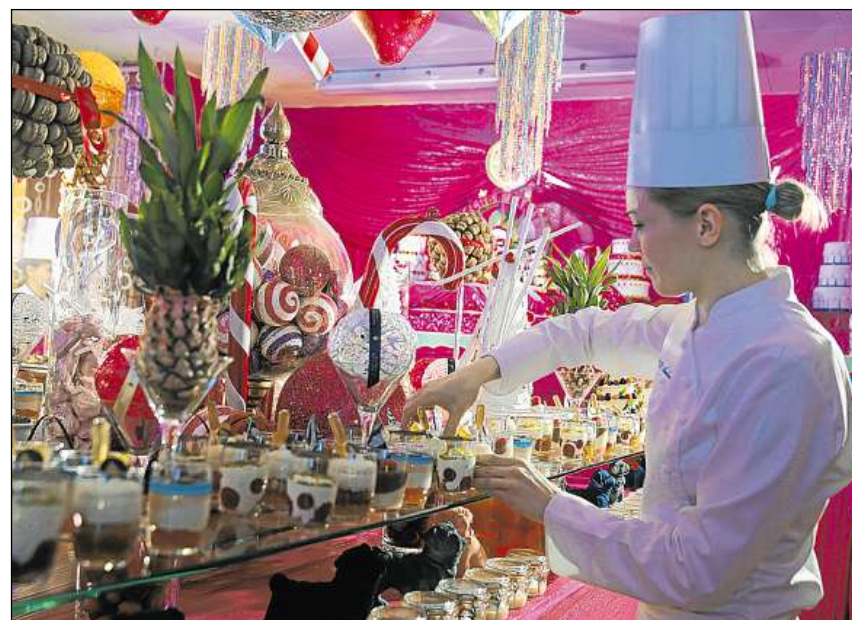
Be bunas chausas er sin il buffet da dessert en l'Hotel Palace a San Murezzan.