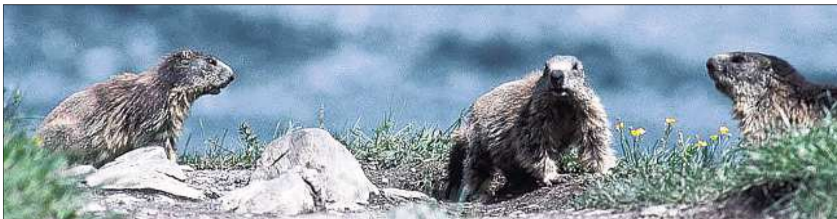
Las muntanellas gaudan la stad en il Parc Naziunal Svizzer.

Perscrutar: Co sa sviluppa la natira senza l'influenza da l'uman? La perscrutaziun da basa e la perscrutaziun da lunga durada gidan a chapir ils process cumplex. Scenziadas e scenziads da divers instituts da perscrutaziun nizzegian quest laboratori al liber unic per acquistar enconuschientschas davart il svilup da las spezas e las midadas dals spazis da