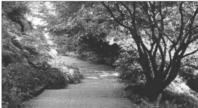
2003 han passa in milliun umans visità la Mainau.

l'ha adoptà sco ertavel e conregent, perquai che Carl n'aveva nagin uffant. 1813 ha la Svezia s'alliada cun la Prussia encunter la saida da pussanza da l'imperatur Napoléon. Lura ha Bernadotte, numnà oramai prinzi Carl Gion, surpiglià il commando da l'armada dal nord. 1814 ha il principi battì las truppas danai-