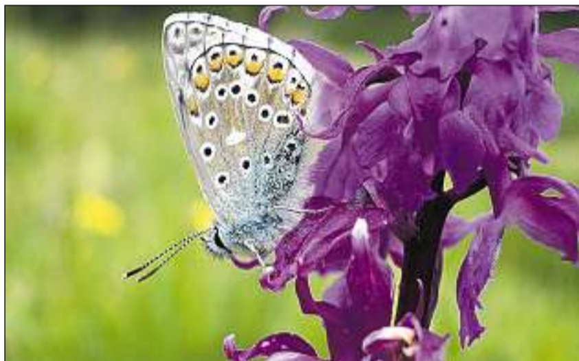
Il Parc Naziunal è enconuscent per sia ritga flora alpina.

Il 1936 ha il Parc Naziunal stuì acceptar in'emprima sconfitta: sin gjavisch da la vischnanca da Scuol è la Val Tavrü puspe vegnida separada dal Parc. L'onn 1957 ha acceptà la populaziun svizra, suenter cumbats da votaziuns fitg agitads, da dar la concessiun a las Ovras Electricas En-