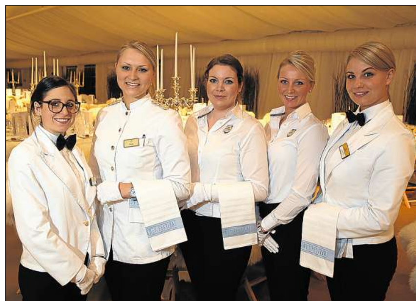
Tar in festival per mangiabains manca er betg il servis gentil.