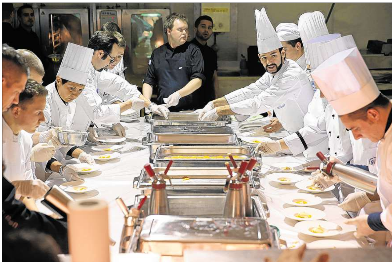
Cuschiniers en acziun durant il grond final sin il lai da San Murezzan.