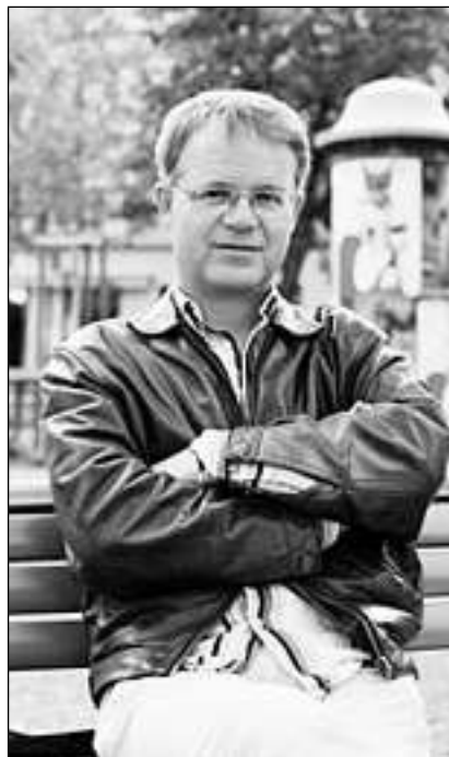
L'autur en la libreria Bertastrasse che ha gia vendi tschients da ses crimis.

han plaunsieu era success ordaifer la Svizra, sco il servetsch da pressa da la chasa editura grafit a Dortmund di. Quai n'ha probabel betg mo da far cun ils cas criminalistics. Cler, i dovra saung, sgarschur e snavur en in crimi. Ma sch'ina seria da crimis ha success u betg dependa cunzunt dal persunal che l'autur descriva. Ed il cumissari Fred Staub è propi in tip ch'ins accumpogna gugent sco lectur.