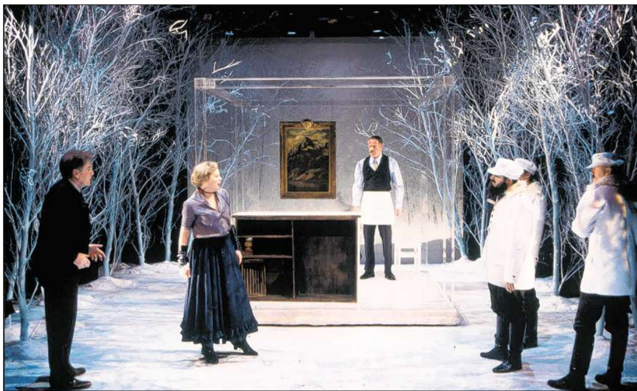
Er en il teater popular èn sa fatgas valair tematicas e furmas d'inscenzaziun modernas.

Il reschissur analisescha il text. In'analisi fundada gida a chattar la dretg'interpretaziun dal toc, da las singulas rollas respectivamain characters e da lur motivaziuns. Il reschissur elavura in concept dal toc. En il cudesch da reschia fa el ponderaziuns davart las persunas e lur characters,