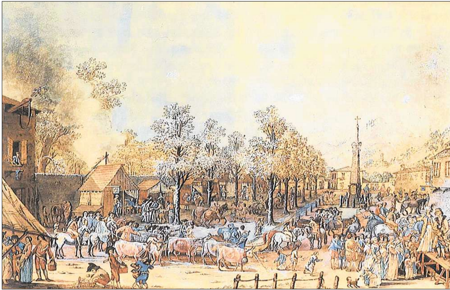
«Fiera grossa» a Lugano. Maletg da Rocco Toricelli, 1799.

1941 obligatorica. Il 1925 è vegnida fundada l'Associaziun per l'utilisaziun da portgs. Suentar la Segunda Guerra mundiala èn naschidas sin plaun regiunal e naziunal numerusas autras organisaziuns parentadas. Da quellas èn ressortidas tranter auter il 1949 l'Associaziun svizra per il provediment da muvel da maz e da charn che sa numna dapi il 2000 Proviande. Il 1957 ha la Confederaziun prendì per l'emprima giada mesiras per promover la svieuta da muvel da razza e da maz, oravant tut da regiuns muntagnardas. La midada structurala da l'agricultura, las midadas tecnicas (tecnica da tegnair a frestg), l'internaziunalisaziun e la globalisaziun dals martgads han transformà radicalmain il commerzi da muvel dapi ils onns 1960 e pretendan dals purs ina gronda flexibilitad sin il martgà agricul determinà dal stadi (per part a moda subsidiara) e dals gronds distributurs.