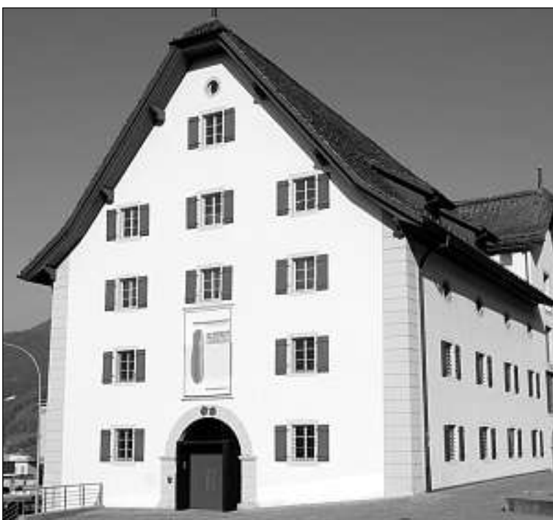
En questa filiala dal Museum naziunal a Sviz ha lieu l'exposiziun «Das Sackmesser – Ein Werkzeug wird Kult».

En connex cun il giubileum da 125 onns da victorinox vegn organisada ina concurrenza da fotografar cun il motto «Mes cuntè da satg & jau». Ins tshergetga fotografias impressiunantas, persvadas u originalas che mussan la relaziun dal carstgaun cun ses cuntè. Las fo-