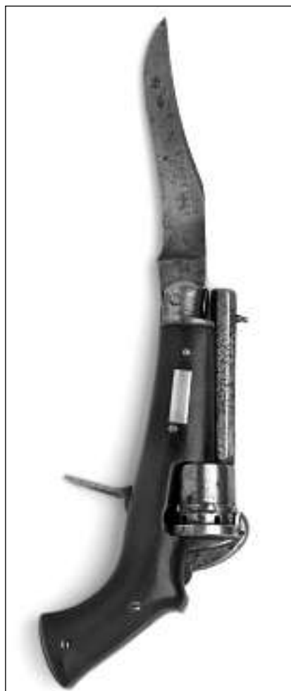
In cuntè da revolver, enturn 1890.

d'october fa la giuria enconuschent las ventg fotografias premiadas.