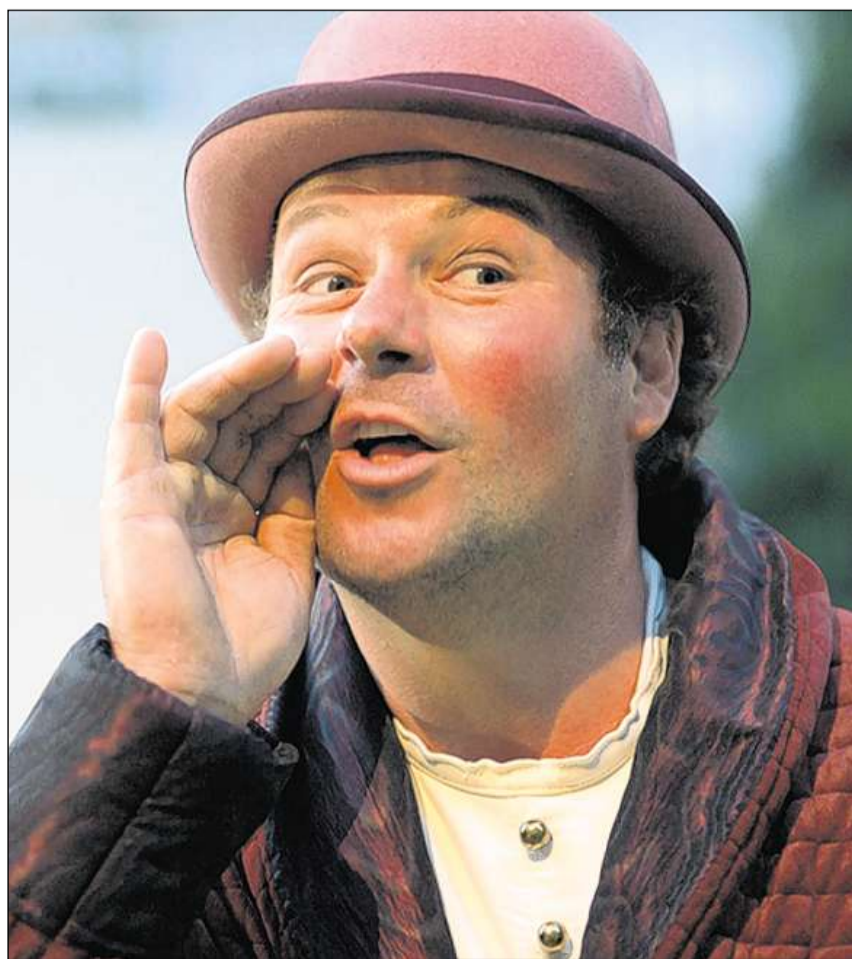
Sa schluitar en ina rolla cun corp ed olma.