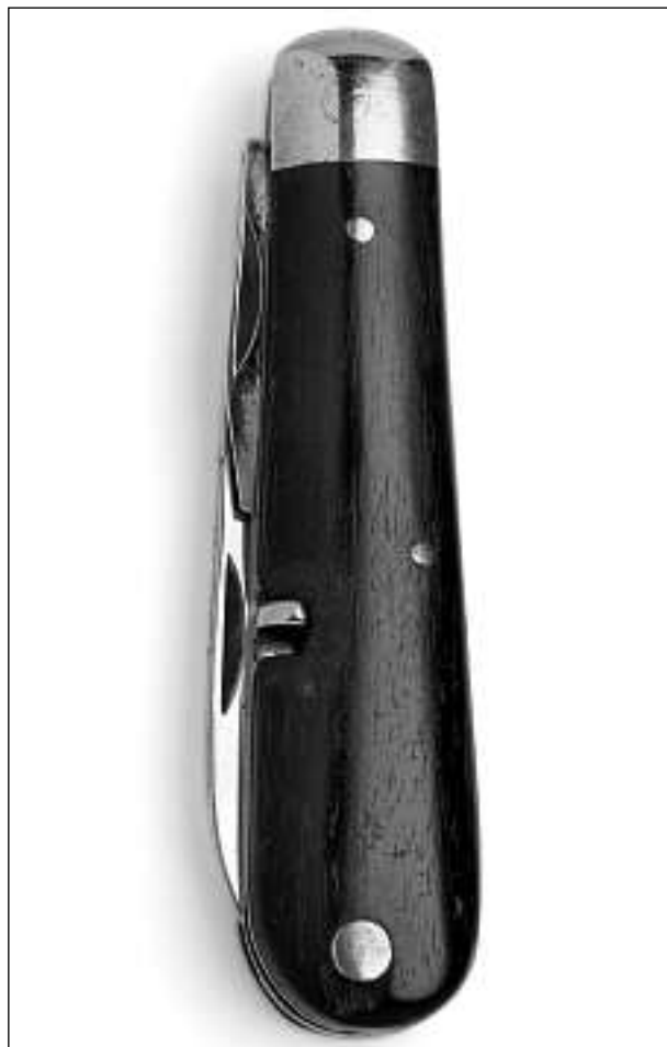
L'emprim model dal cuntè da schuldada il 1891 cun moni da lain nair.