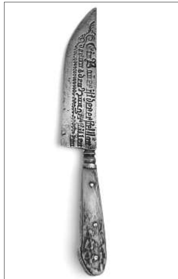
In cuntè encunter spierts cun l'inscripziun: «Ein Bauer ist der erste Man, der uns den Hunger stillen kann.»