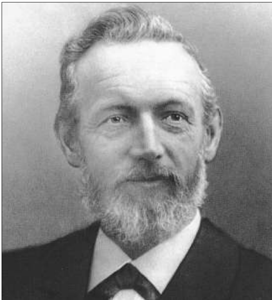
Karl Elsener ha inventà il 1890 il cuntè da schuldà svizzer e fundà pli tard ina firma ch'è oz la victorinox ad Ibach.