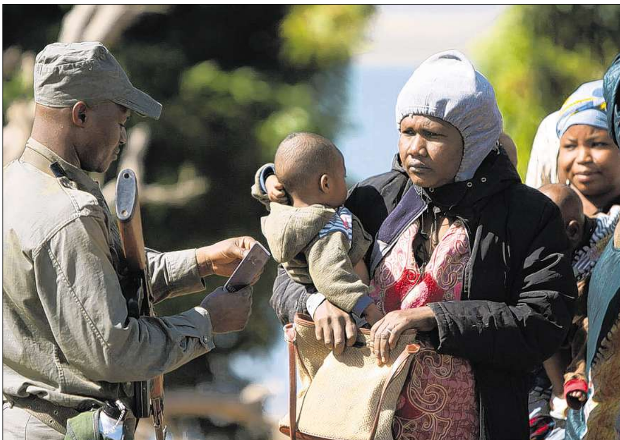
Hollande ha empermess als Franzos che lur schuldada na duaja betg pli cumbatter il pli davant en lur anteriuras colonias. Ussa cumbatta l'armada franzosa en Mali gruppas armadas «dschihadistas» che domineschan ina part dal pajais.