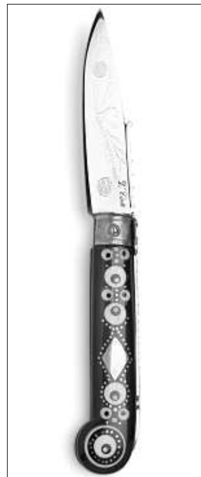
Il «coltello d'amore» – in regal da spusalizi en l'Italia.