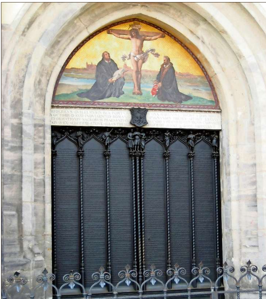
Las 95 tesas da Martin Luther che dateschan da l'onn 1517 èn perpetnisdas sin il portal da la baselgia dal chasti da Wittenberg.