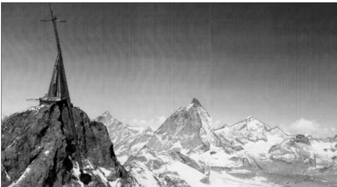
Planisà: Il Matterhorn pitschen cun ina piramida d'atschal e vaider da 117 meters. La tur d'Eiffel a Paris mesira dal reminent 300 meters.

Opposiziun datti dentant adina en sanua. Sco il «Beobachter» (nr. 13) scriva s'oppona la fundaziun per la tgira da la cuntrada encunter la piramida sin il Matterhorn pitschen.