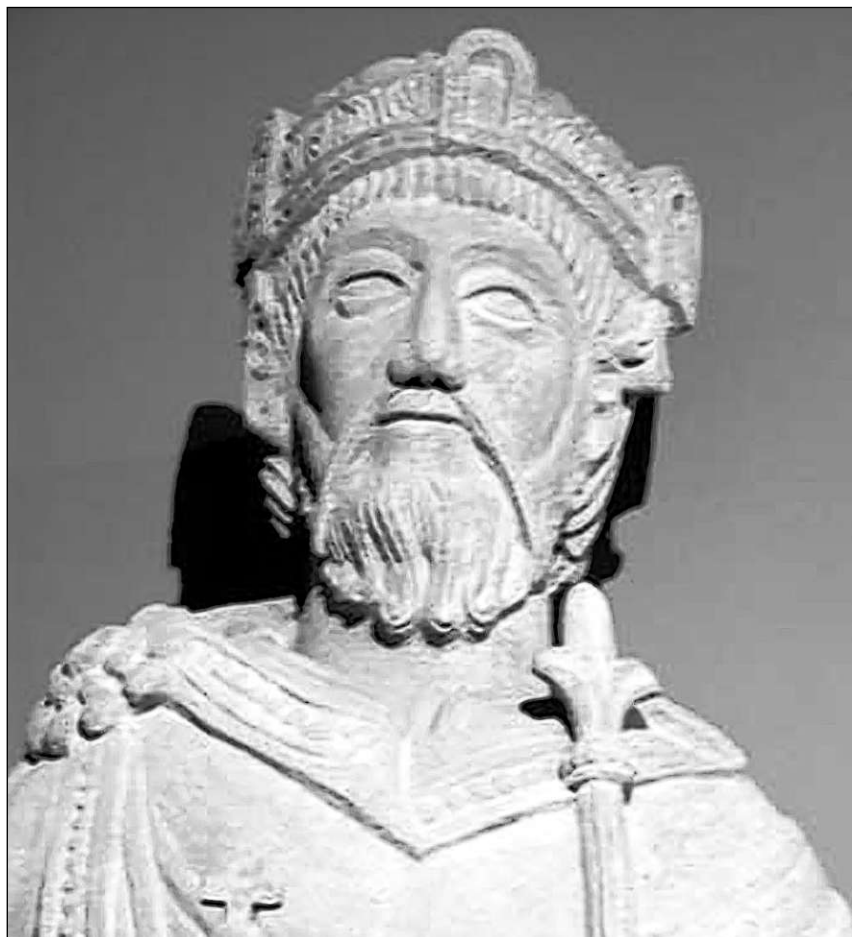
Statua da Carli il Grond en la claustra da Müstair.

Ils monarcs francons stevan il pli savens en Germania u en la Gallia dal nord. En Italia gievan els sur ils pass retics u sur il Grond Son Bernard. «Ins duvrava las claustras sco albierts per viagiaturs, oravant tut per nobels e cunzunt per il retg e sia suite (...). Segund l'interpretaziun provisorica da las exchavaziuns en la claustra carolingica da s. Gion a Müstair, cumpigliava lezza, na be in'ampia residenza destinada evidentamain per l'uestg da Cuira e ses giasts, mabain er ina vasta ala ch'ins duvrava probablmain sco albiert (...). Impressionant èsi plinavanz ch'ins fundava las claustras carolingicas lung las vias da transit dals pass retics. Ins collia il 'xenodochium sancti Petri', menziunà en l'emprima mesadad dal 9avel tschientaner, cun la claustra da