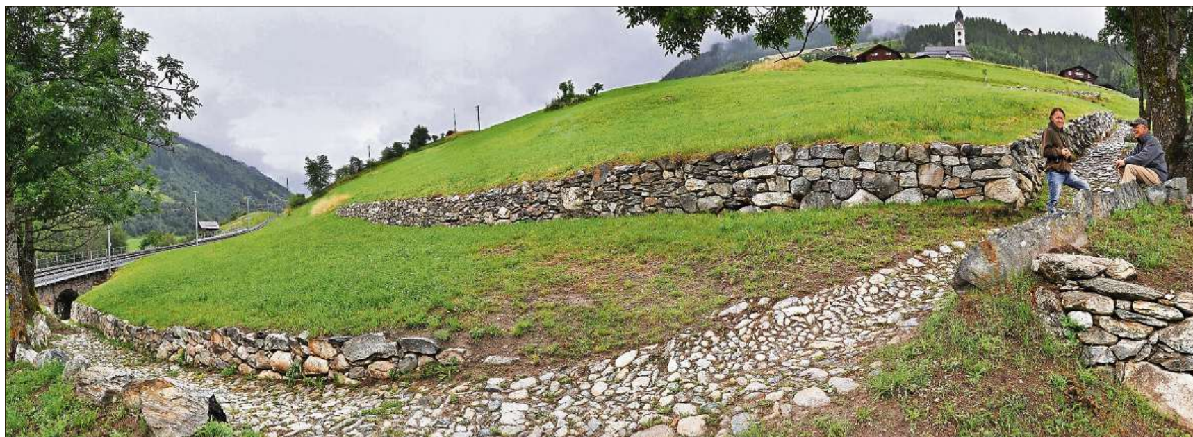
La Via dil Crucifix per viandants è la pli curta colliaziun tranter Surrein e Sumvitg. Quella è vegnida sanada e sa preschenta puspè en ses stan oriund.

«Il Fond Svizzer per la Cuntrada è er in Fond Svizzer per la Biodiversitad – ed en il futur pudess el esser quai anc pli savens», scriva il president dal FSC en ses artitgel da princip. Las cuntradas cultivadas tgiradas e revalitadas cun il sustegn dal FSC tutgian tar las surfatschas cun la pli gronda diversitad da spazis da viver e da speziars d'animals e da plantas. L'engaschament dal FSC per cuntradas cultivadas en accord cun la natira giaja uschia maun en maun cun la promoziun da la biodiversitad. Perquai han ins proponì d'extender il FSC en favur da la biodiversitad, d'al conceder ulteriurs meds finansials e d'al garantir ina prolungaziun illimitada sco mesira concreta per il plan d'acziun Biodiversitad, il qual vegn actualmain preconsultà dals chantuns. Da l'eco dals chantuns e da la procedura da consultaziun planisada il 2016 spera il president dal FSC in «signal empermettent per l'ulteriura discussiun en connex cun la prolungaziun dal FSC». Quella duai vegnir lantschada il 2016 – per il giubileum da 25 onns dal FSC – cun il parlament nov elegi.