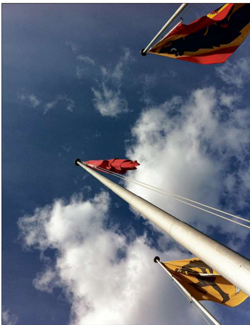
Il federalissem reparta las competenzas politicas sin differents nivels statals.

Las competenzas èn Svizra sco stadi federal en repartidas tenor il princip da subsidiarità sin la Confederaziun, ils chantuns e las vischnancas. La Confederaziun