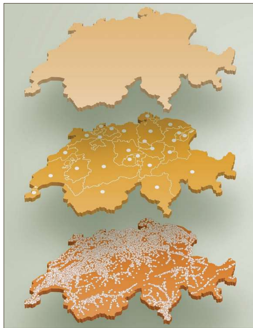
Visualisaziun dal federalissem svizzer tenor la brochura d'infurmaziun «La Confederaziun en furma concisa».

La pussanza executiva sin plaun chantunal ha la regenza chantunala. Quella sa cumpona tut tenor chantun da 5 fin 7 commembras e commembers. Per regla maina mintga commember da la regenza in departament (per exempel il departament da finanzas, il departament da sanadad, il departament d'edu-