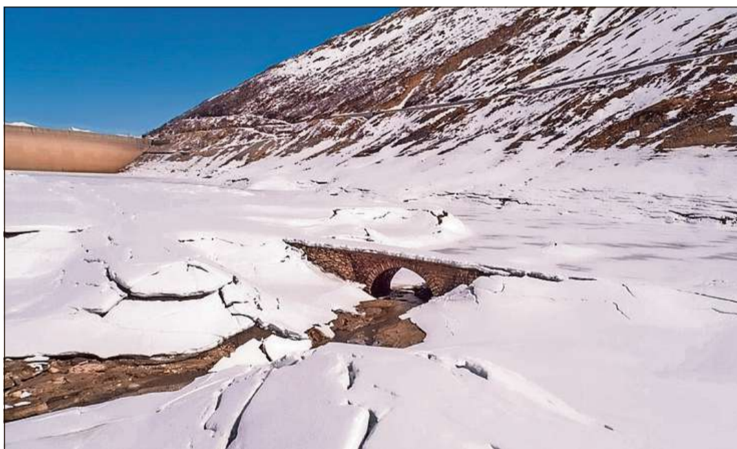
En il funs dal lai da S. Maria è da vesair la punt romana.