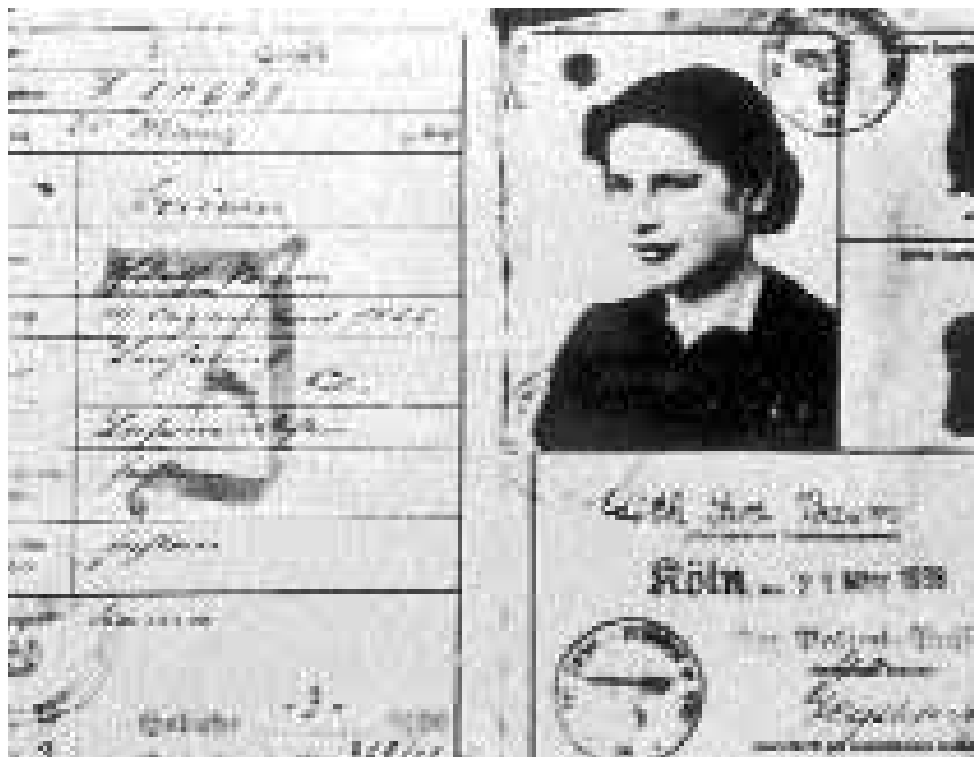
In punct stgir en l'istorgia svizra: Il bul «J» per ils Gidieus.