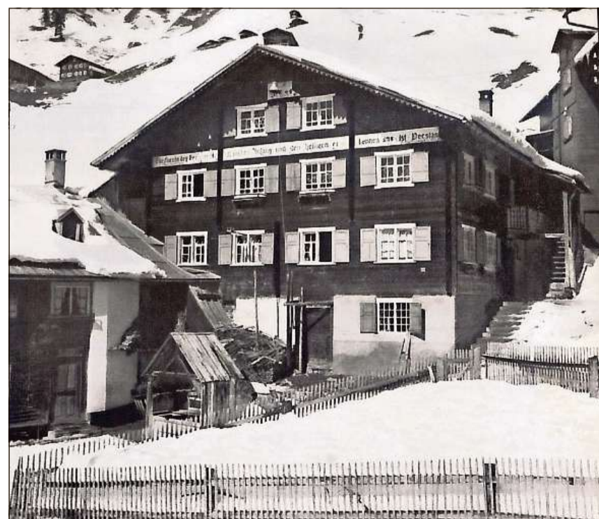
S. Antònia – ina da las numerusas chasas da scola che derivan dal temp da l'obligatori da scola dals onns 1840.