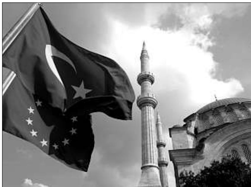
La Turchia gioga ina rolla impurtanta tranter il continent europeic, la Russia ed il Proxim Orient.

L'editorial punctuescha: «La Turchia è vegnida bier pli relevanta en il davos decenni. Ella ha fatg atras duas profundas transfurmaziuns ch'ins na renconuscha anc betg adina lunsch enturn (...). Sia economia crescha svelto; (...) ella producescha mobiglia, autos, chalzers, televisiun, ed è il pli grond pajais exportader da cement (...). Grazia a sia ferma economia è sia diplomazia vegnida fitg activa en il Proxim Orient, il Balcan e schizunt l'Africa.» Il supplement precischa: «La Turchia è uss ina commembra udibla